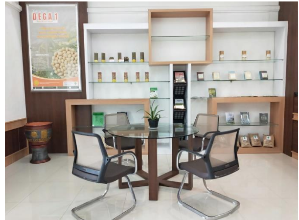
Gambar 2. Ruang Tunggu Publik