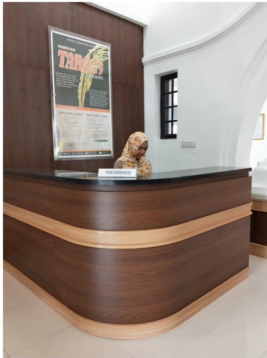
Gambar 1. Counter Desk Informasi Layanan